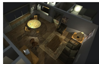
Room of Shadow