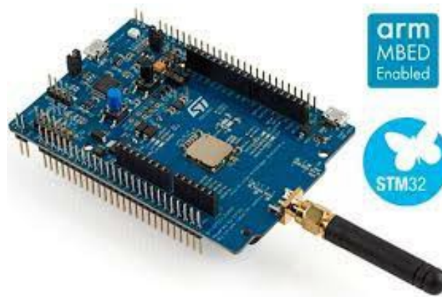
Figure 1 : kit Discovery référencé B-L072A-LRWAN1

Une fois mis en place, ce réseau permettra d'utiliser des objets connectés pour mesurer la qualité de l'air ou la température par exemple et d'autres informations.