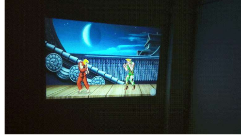
Exemple 2: Jouer à Street Fighter avec des mouvements